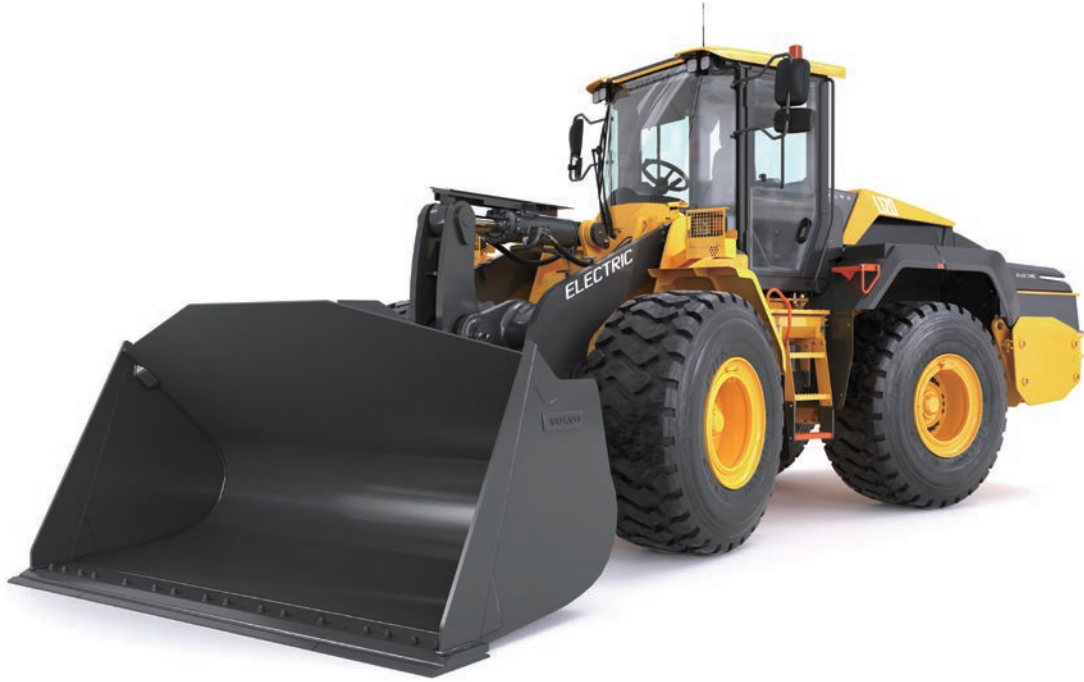
沃尔沃轮式装载机 18.5-20.5 吨 (整机重量)